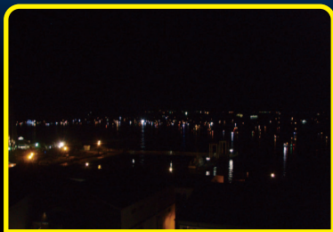
街灯・船舶灯火・標識灯火・反射光など判別困難